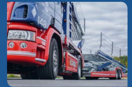
MODERNER TRANSPORT MIT ZUG 148