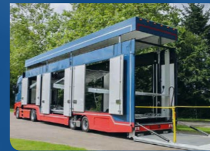
GESCHLOSSENER AUTOMOBIL TRANSPORT